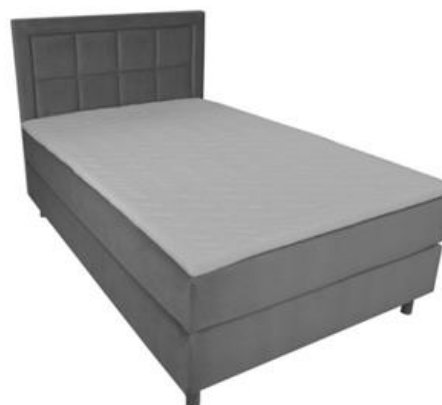
Rysunek nr 2 (poglądowy): łóżko wraz z materacem